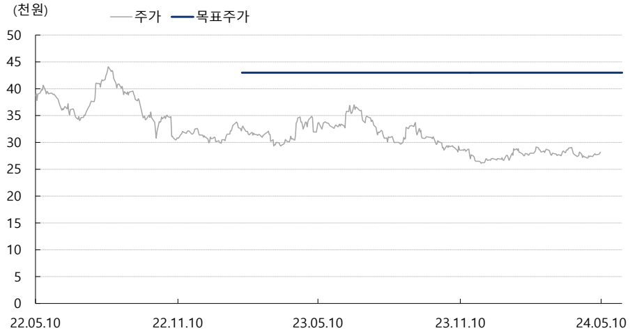
뷰웍스 최근 2년간 목표주가 변동추이